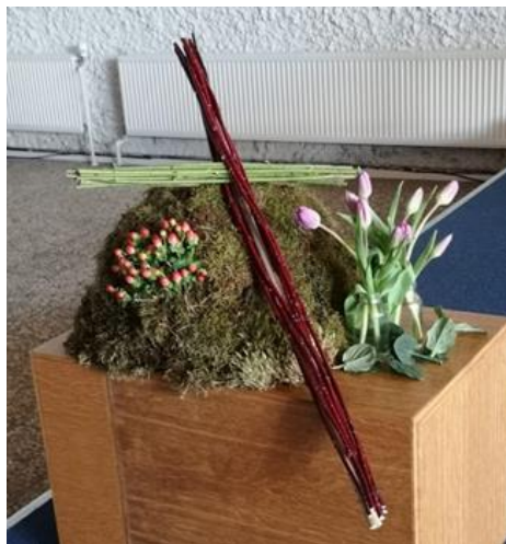
Schikking 1 e zondag van de 40dagentijd