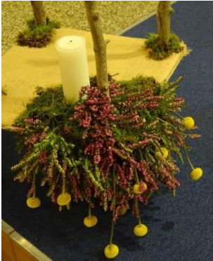
Bloemschikking 1e advent

heel dichtbij en nodigt ons in Zijn nabijheid.