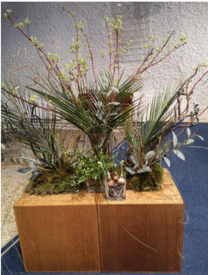
Symbolische schikking bij zondag 29 maart jl.

Op Stille Zaterdag zien we in de schikking een verwijzing naar de balseming en het neerleggen van Jezus in het graf. Het intense verdriet van de vrouwen die bij de kruisiging aanwezig waren. Een enkele bloesentak is daarvan ook weer een teken. Een beweging naar een nieuw begin. We mogen samen vooruit!